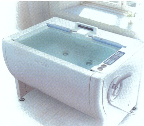
● まったく必要のないソファバス 収納式スウィング扉で楽しく入浴