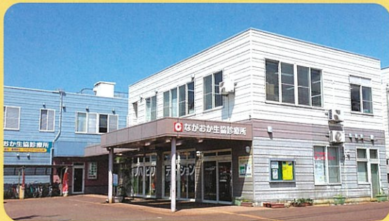
ながおか生協診療所 (内科・消化器内科)