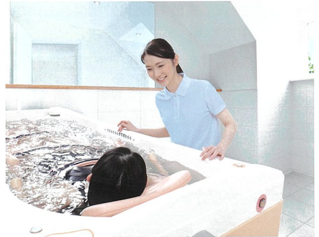
● 毎回新湯方式の多機能浴槽 チルト機能でゆったり入浴