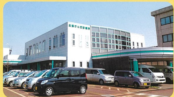
生協かんだ診療所 (内科・循環器内科)